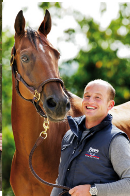
Michael Jung · Sam